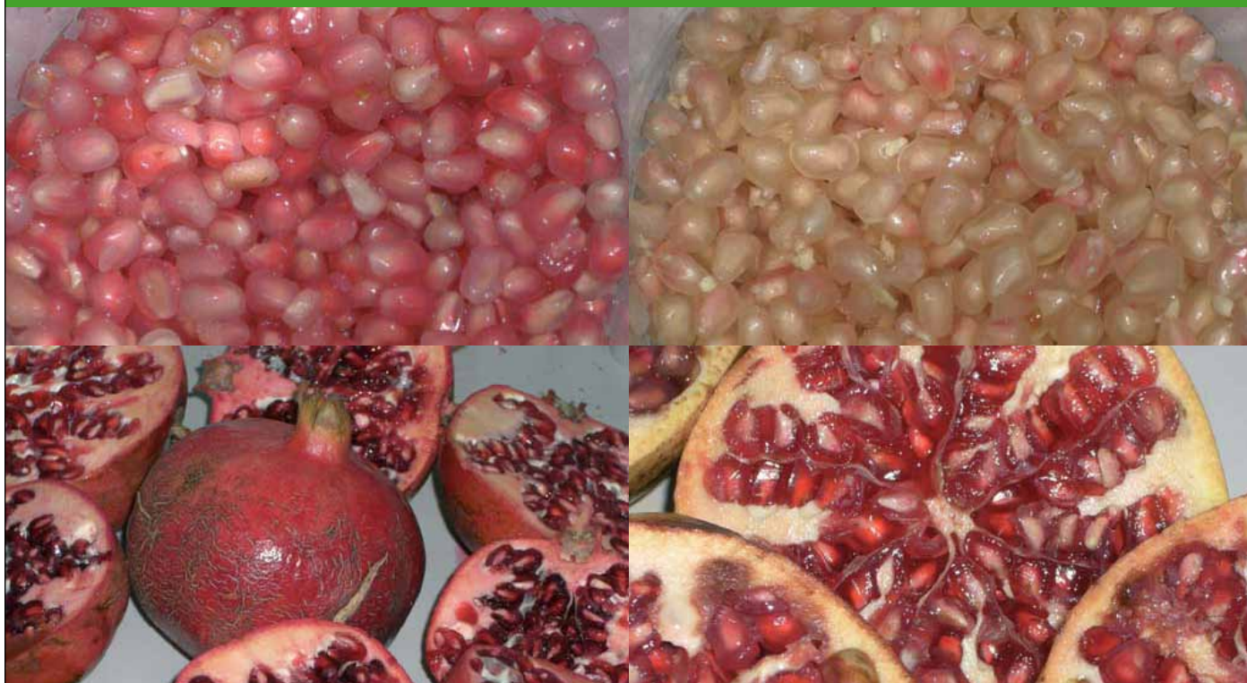
Fig.3: Fruit frais / Pulpe de différentes variétés de grande

aigres, aigres-douces et douces. [Cemeroglu et al. 1992 ; Velioglu et al. 1997 ; Melgareio et al. 2000]