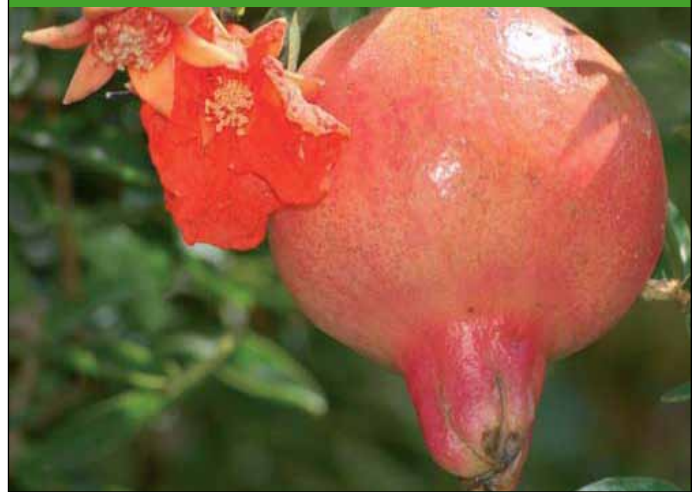
Fig. 2: la grenade: arbre, fleur et fruit

vert jaune ou blanchâtre, rarement violet foncé. Les nombreuses graines de la grosseur d'un petit pois sont entourées d'une pulpe juteuse, rougeâtre ou blanc jaunâtre qui est la partie comestible (fig. 3). Le goût est aigrelet ou aigre-doux astringent. L'écorce de l'arbre a un effet vermifuge grâce à sa teneur en alcaloïdes, les pelletiérines, et était utilisée jadis comme moyen de combattre le ténia, l'ascaride et la diarrhée.